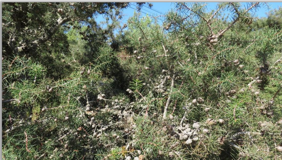
Figura 8 – Banco de sementes arbóreo de háquea-picante

Uma vez formados, os frutos de háquea-picante persistem na planta ao longo de toda a sua vida. As sementes mantêm-se alojadas nos frutos, formando um verdadeiro banco de sementes arbóreo.