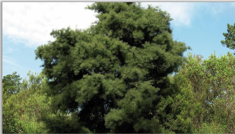
Figura 1 – Árvore adulta de háquea-picante

A háquea-picante possui geralmente porte arbustivo, mas pode atingir até 4 metros de altura, assemelhando-se a uma pequena árvore (excecionalmente pode atingir até 10 metros de altura). Esta espécie invasora, oriunda da Austrália, encontra-se distribuída um pouco por todo o território do continente português, embora seja mais predominante na faixa do litoral .