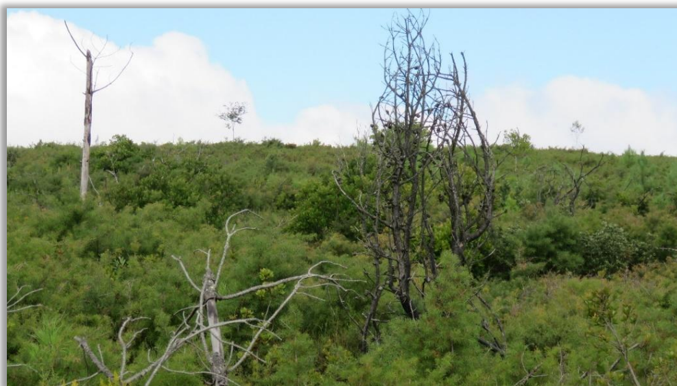
Figura 12 – Área invadida por háquea-picante

Nas situações em que já existe fruto, e na perspetiva do controlo da háquea-picante, são sempre necessárias pelo menos duas intervenções de controlo, necessariamente desfasadas no tempo: