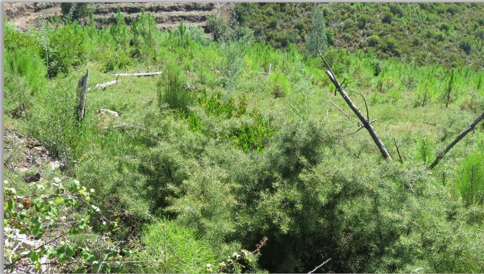
Figura 13 – Regeneração simultânea de pinheiro-bravo e háquea-picante

A gestão destas situações depende da densidade da regeneração natural de ambas as espécies. A competição da háquea-picante pode atrasar o desenvolvimento do pinheiro-bravo, no entanto, a dada altura, se a densidade deste for suficiente, começam a evidenciar-se as copas de pinheiro-bravo acima do nível das háqueas-picantes. Regra geral, quando tal acontece, o pinhal será viável, sobretudo após o fecho das copas.