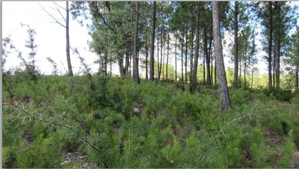
Figura 14 – Pinhal adulto com regeneração de háquea-picante no subcoberto

Esta dinâmica destaca a importância de um planeamento cuidadoso, considerando o momento apropriado e o ciclo de vida das espécies ao realizar intervenções para o controlo da háquea-picante.