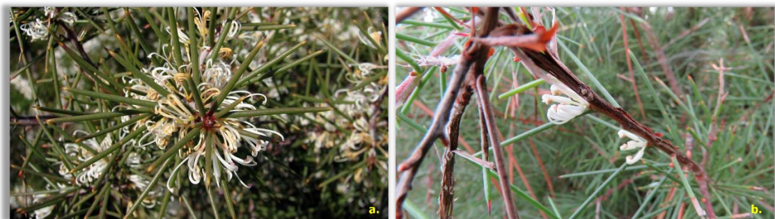
Figura 4 – Floração de háquea-picante

As flores são brancas ou creme, pouco vistosas e podem libertar um ligeiro aroma a mel ou amêndoas. A floração inicia-se em novembro/dezembro e estende-se até meados de março ou abril do ano seguinte.