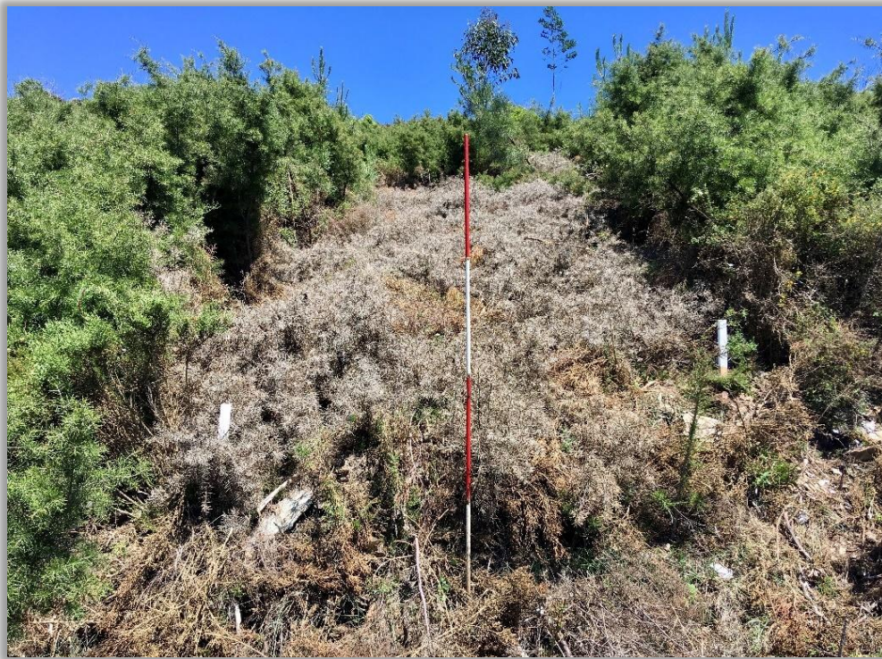
Figura 16 – Povoamento adulto de háquea-picante, com cerca de dois metros de altura – aspeto do material cortado pronto a queimar (fonte: Projeto Fogo e Invasoras)