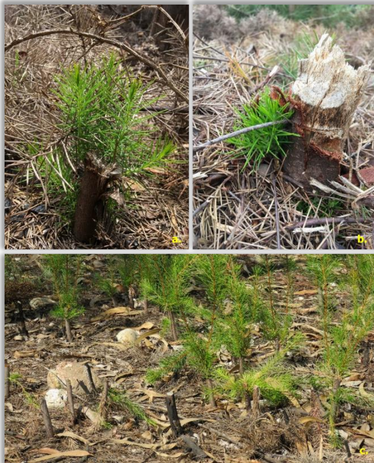
Figura 15 – Exemplo de alguns cortes mal-executados (não são cortes rentes ao solo, nem corte limpos) (a. e b. fonte: Projeto Fogo e Invasoras c. foto por Ernesto Deus)

Para garantir uma abordagem bem-sucedida, é prudente prever um tempo médio de realização superior ao habitual, na ordem dos 20%, embora estes valores variem com as condições do terreno, o tamanho das plantas, entre outros.