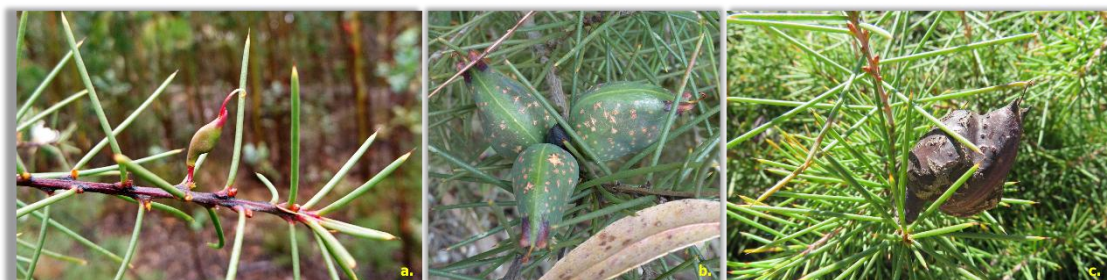
Figura 5 – Diferentes fases de desenvolvimento dos frutos de háquea-picante | a e b – frutos verdes, imaturos; c – fruto maduro

Os frutos de háquea-picante (fóliculos) são lenhosos, verdes na fase inicial, tornando-se castanho-escuros quando maduros, com forma ovoide e um bico na extremidade. Têm cerca de 3 a 4 cm de diâmetro, e, geralmente, surgem em grupos de dois ou três.