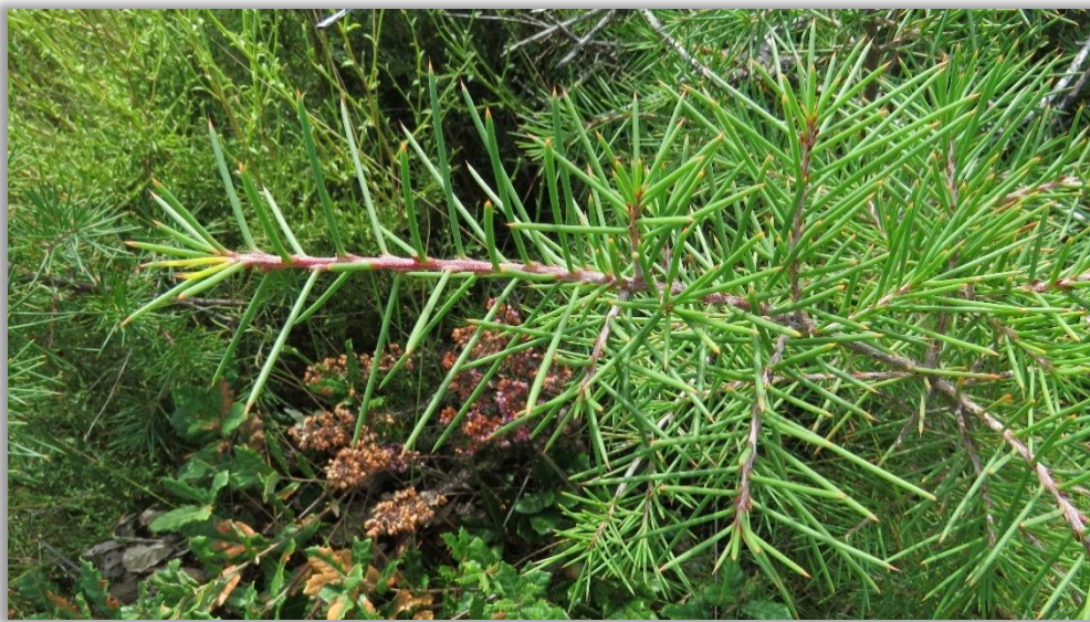
Figura 3 – Aspeto das folhas de háquea-picante

As folhas de háquea-picante são persistentes, verde-escuras, rígidas e em forma de agulha. O nome comum da espécie sugere uma característica relevante na identificação, mesmo nos indivíduos mais jovens – é extremamente picante ao toque.