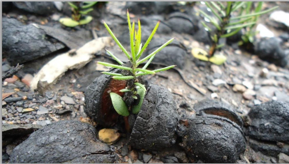
Figura 6 – Germinação de háquea-picante

É importante notar que a capacidade de rebentação de toça da háquea-picante está sujeita a diversos fatores, incluindo a idade da planta, a dimensão do tronco, a altura do corte e a época do ano em que ocorre.