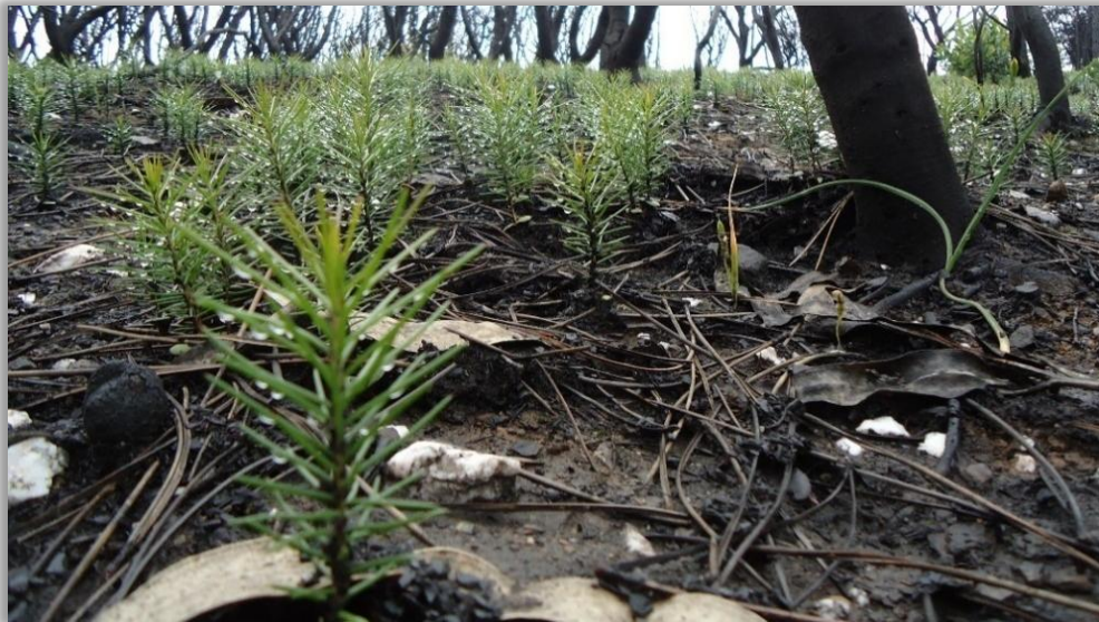
Figura 10 – Regeneração natural de háquea-picante

como as do pinheiro-bravo, são persistentes, verde-escuras, rígidas e em forma de agulha.