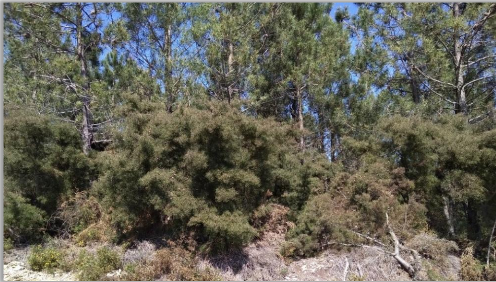
Figura 11 – Aspeto de um pinhal adulto invadido por háquea-picante

É relevante salientar, com base na experiência prática no terreno, que a háquea-picante enfrenta dificuldades em competir em solos mais produtivos, onde os matos, como a urze e a carqueja, por exemplo, já atingiram alguma dimensão e densidade. Esta situação pode estar relacionada ao facto dessa vegetação criar alguma sombra no subcoberto, dificultando a germinação de háquea-picante.