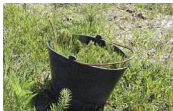
Fig. 3 – Colocação dos lançamentos num balde com água.