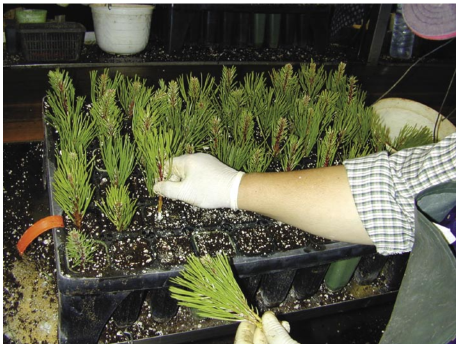
Fig. 8 – Colocação das estacas nos alvéolos do tabuleiro.