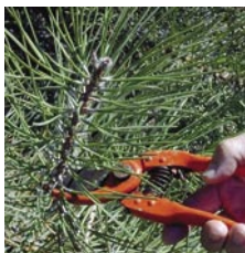
Fig. 2 – Corte do lançamento terminal.

Corte o lançamento da época (terminal se a planta nunca foi cortada, ou lateral se já deu origem a estacas anteriormente), preferencialmente durante a manhã, e coloque as estacas em baldes com água, para evitar o stress hídrico. Prossiga para o ponto quatro.