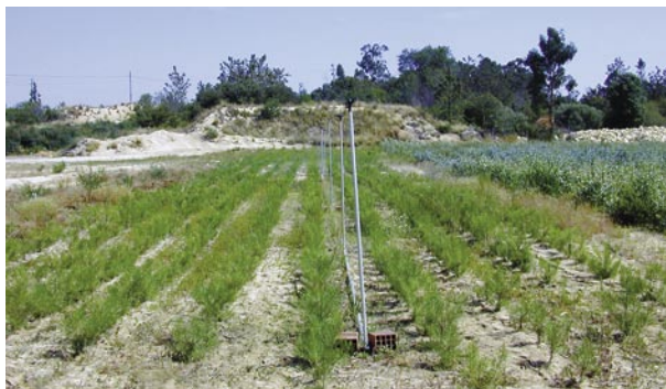
Fig.1 – Parque de pés-mãe, Viveiros Aliança, SA – Herdade de Espirra.

Nota: Um parque de pés-mãe é um local onde se mantém plantas com interesse para futuras multiplicações.