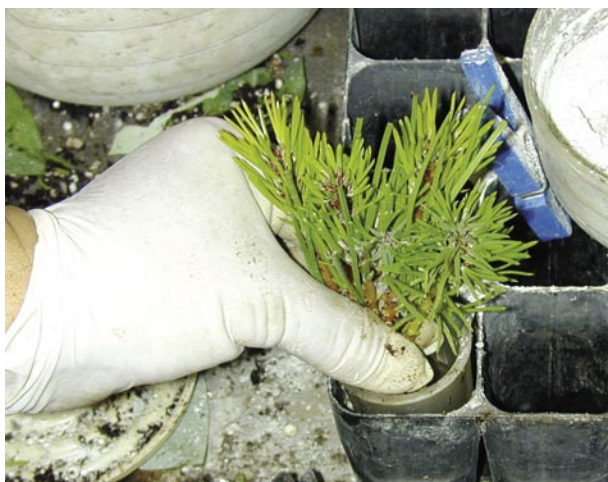
Fig. 7 – Colocação da zona de corte na solução líquida de AIB, durante 5 segundos.

Esta solução terá de ser mudada de 20 em 20 minutos.