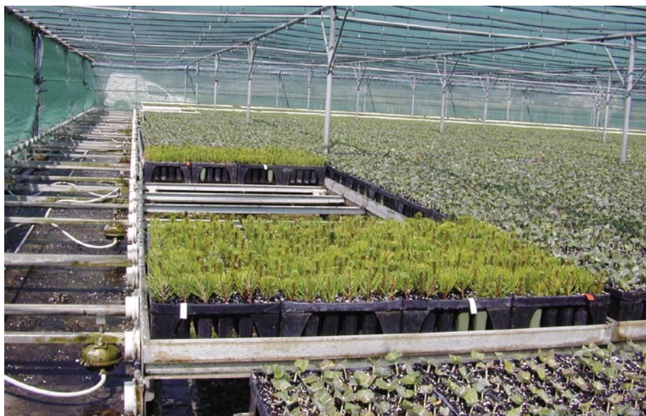
Fig. 10 – Aspecto geral da estufa.