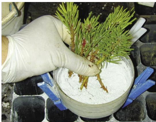
Fig. 6 – Colocação da zona de corte em fungicida.

Coloque a base das estacas numa mistura de fungicida com talco.