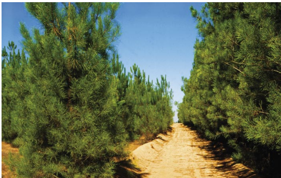
Fig. 12 – Povoamento instalado com plantas produzidas por estacaria

Da mesma forma, a condução dos povoamentos não difere da de plantas seminais. Na figura seguinte, observa-se um povoamento instalado com plantas produzidas por estacaria.