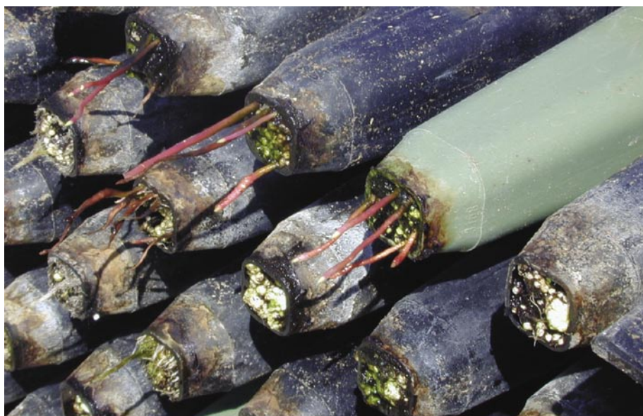
Fig. 11 – Aspecto da emissão de raízes.