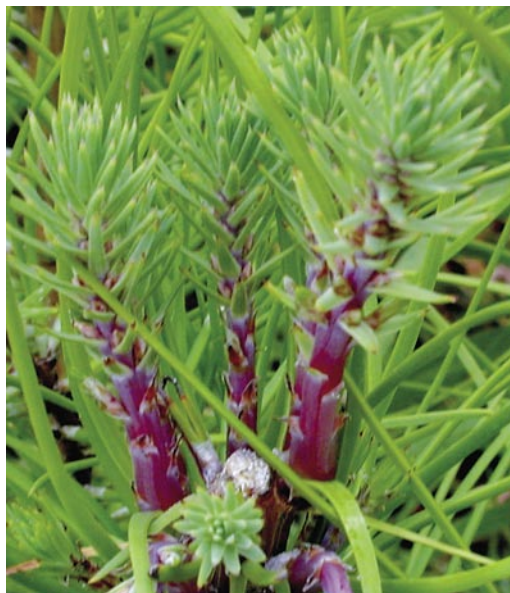
Fig. 4 – Aspecto dos rebentos induzidos pelo corte do lançamento principal.

Nota: O corte do lançamento terminal (que ocorreu na etapa 2) induz o aparecimento de lançamentos provenientes de gomos laterais, os braquiblastos.