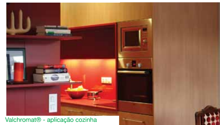
Valchromat® - aplicação cozinha