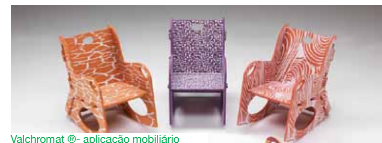
Valchromat® - aplicação mobiliário