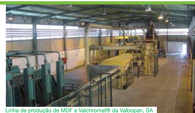
Linha de produção de MDF e Valchromat® da Valbopan, SA

Principais mercados: Ibéria, França, Bélgica, Suíça, Itália, Índia, China, Brasil.